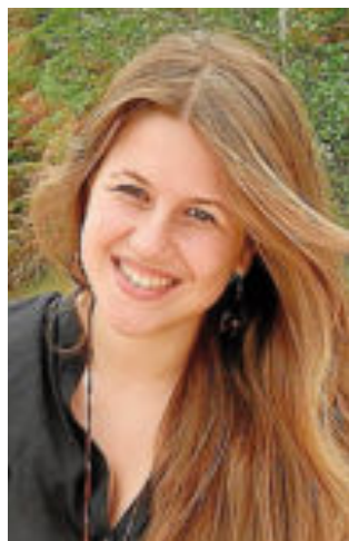
A autora da novela

Amanda é unha brillante rapaza de dezanove anos, pluriempregada e cunha filla dun ano. Limpa a estación e ten unha vida ás súas costas máis propia dunha persoa adulta e responsable ca dunha moza, cunha vida social reducida a breves encontros coa súa nai, quen lle axuda a coidar, mentres ela traballaba, a súa pequena Ánxela.